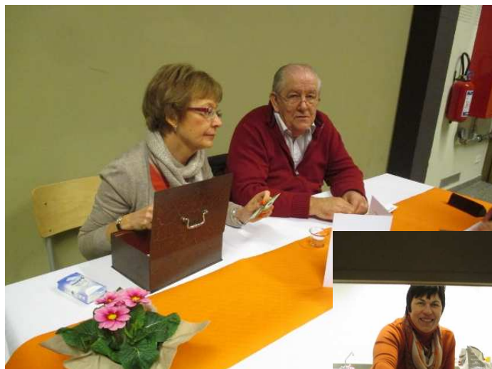
L'équipe du souper aux fromages au profit de la catéchèse d'Ellezelles