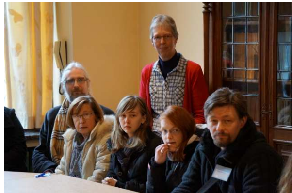
Les 52 catéchumènes de notre diocèse rencontrent notre évêque à l'évêché