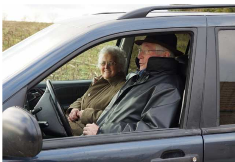
Un co-voiturage bien sympathique