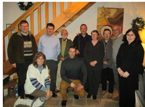
L'équipe solidarité du doyenné