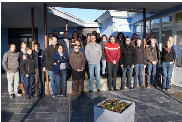
12 couples se préparent au mariage