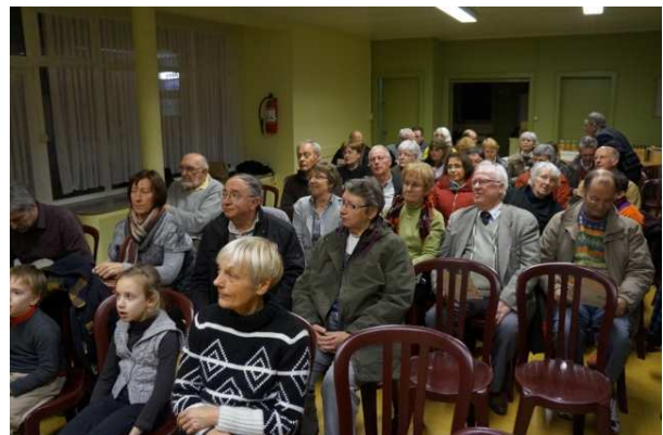
Beau succès pour la projection du film « les moissons du futur ». Merci aux animateurs !