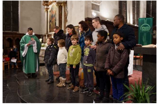
Le KTous « En Christ, tu es prêtre » et l'accueil des futurs baptisés en âge de scolarité