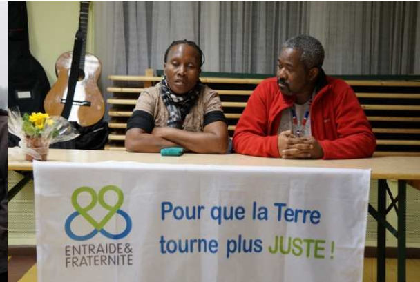
Visite de la ferme Demazy à Wiers et témoignage de la partenaire d'Haïti