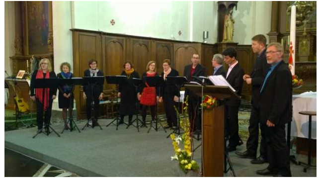
Magnifique concert de la chorale d'Anvaing et de la chorale 'Ad Libitum' de Metz