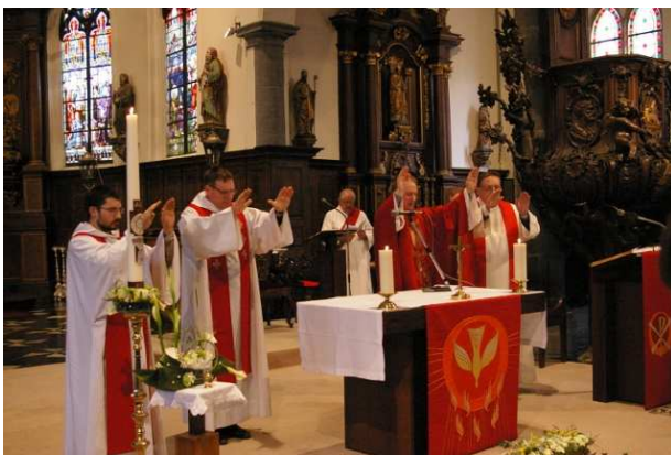
La célébration des confirmations à Ellezelles (imposition des mains, chrismation)