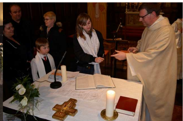
La signature dans le registre de baptême