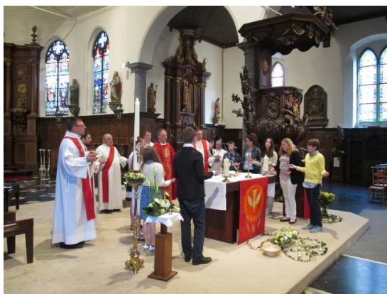
La récitation du Notre Père