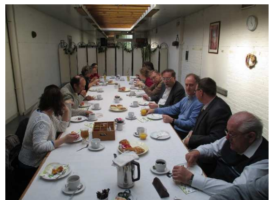
La convivialité après la célébration