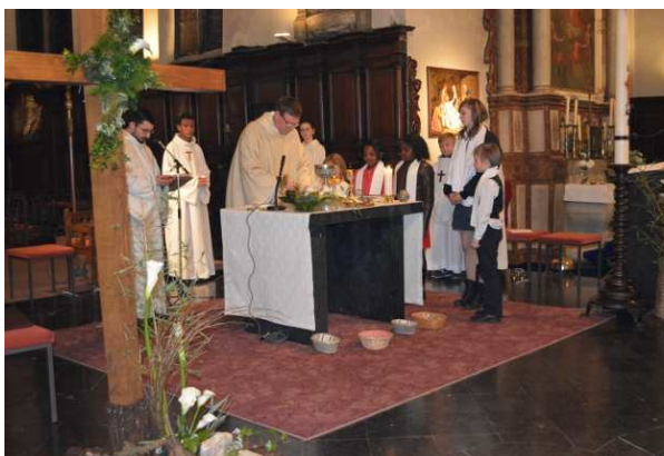
Ils communient tous pour la première fois