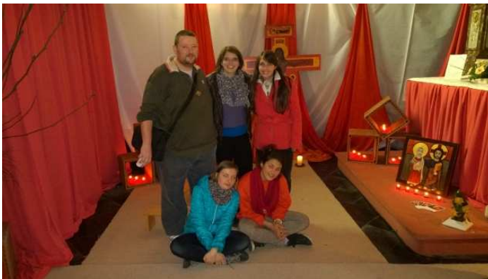
Passage de 3 jeunes de Taizé à Frasnes