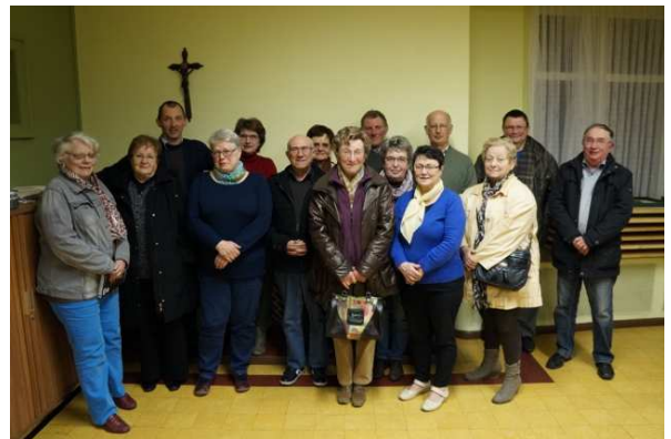
Préparation de la journée 'églises ouvertes'