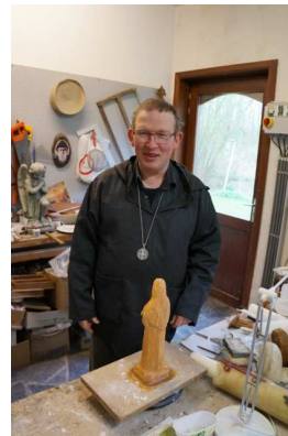
Bonne route avec Saint Benoît !