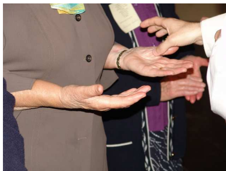
L'onction des malades