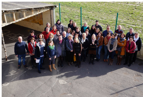
La matinée de pastorale scolaire à St Sauveur