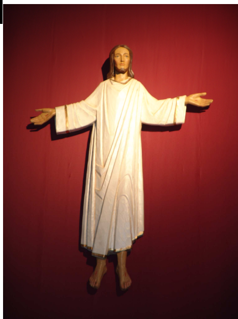
Le Christ Ressuscité de la Basilique de Tongre Notre-Dame