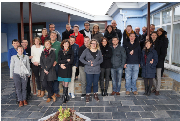
La session de préparation au mariage