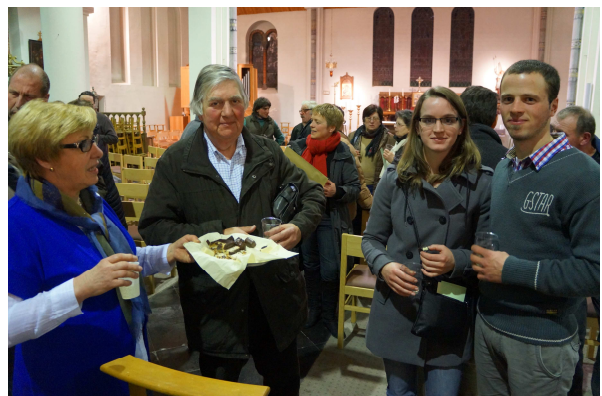
La soirée agricole a connu un grand succès