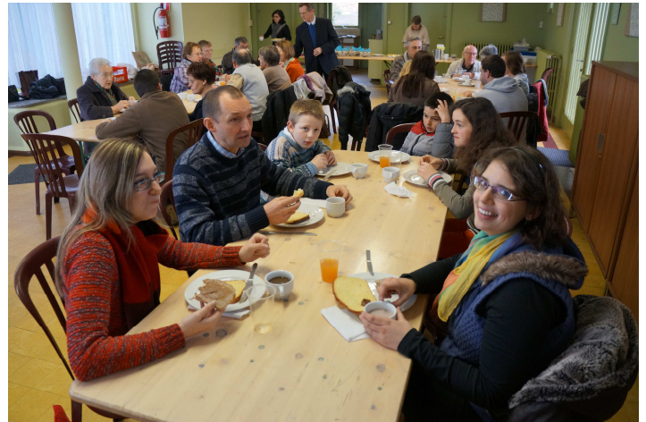
Le petit déjeuner dans la salle de la rotonde de la Belle Eau lors du ressourcement.

Bloquez déjà dans votre agenda le samedi 31 mai, fête de la Visitation : pèlerinage vers l'abbaye de Chimay pour rencontrer le Père Omer, peintre de l'icône de la mission. Infos dans le prochain papillon.