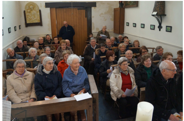
Le chapelet à la chapelle de croix ou pile