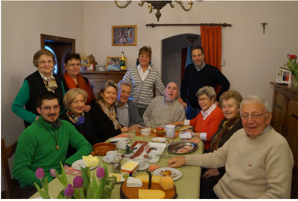
Le rendez-vous petit déjeuner