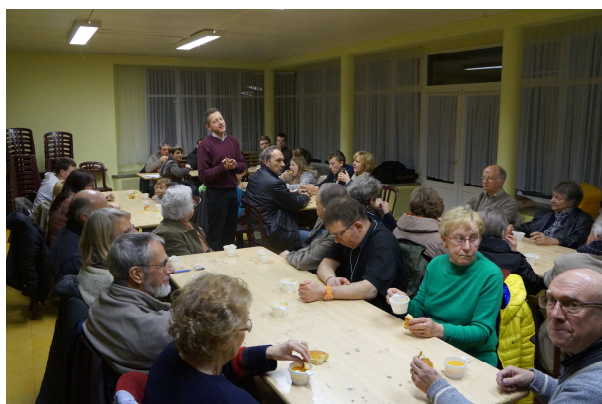
Le bol de soupe du mercredi des Cendres