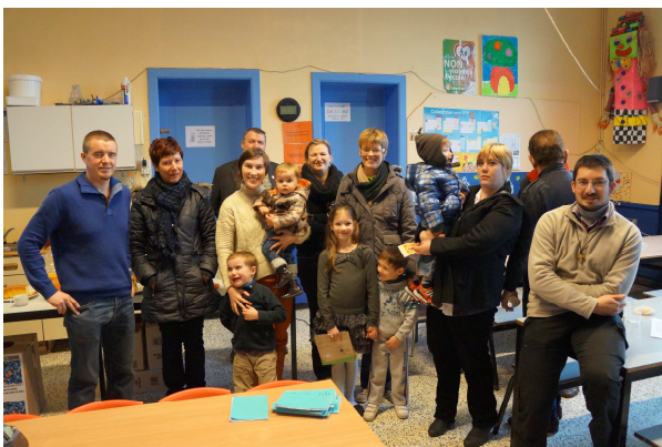
La rencontre avec les baptisés