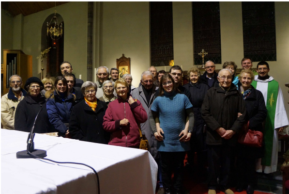
Les couples jubilaires à l'honneur