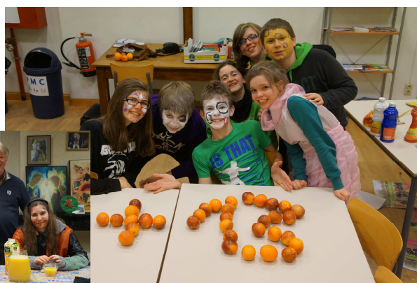
Les '+13' passent du Carnaval au Carême (en médaillon le doyen de Binche)