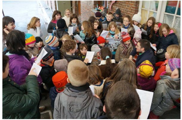
La chorale scolaire répète les chants