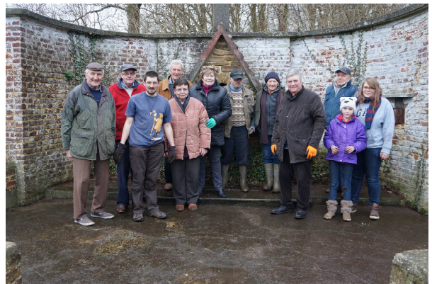
L'équipe nettoyage de la croix des hauts