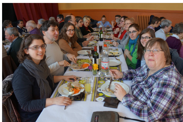
L'assemblée générale des amis de Lourdes