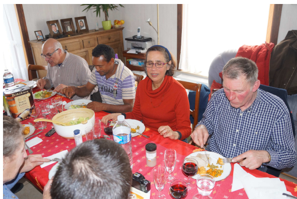
La matinée et la soirée avec le partenaire brésilien d' « Entraide et Fraternité »