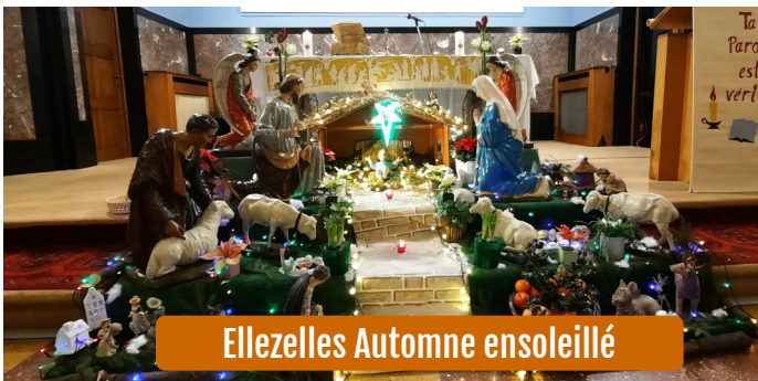
Ellezelles Automne ensoleillé