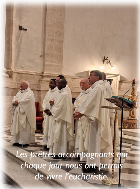
Les prêtres accompagnants qui chaque jour nous ont permis de vivre l'eucharistie.

que le Seigneur nous accueille et nous ouvre le chemin.