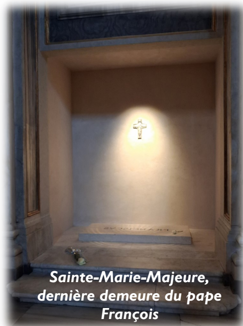
Sainte-Marie-Majeure, dernière demeure du pape François