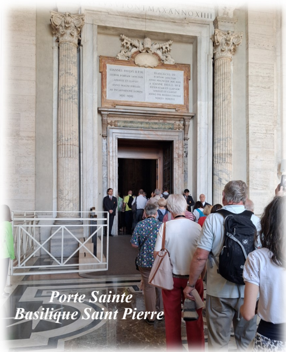
Porte Sainte Basilique Saint Pierre

Nous en gardons des souvenirs forts et une foi renouvelée