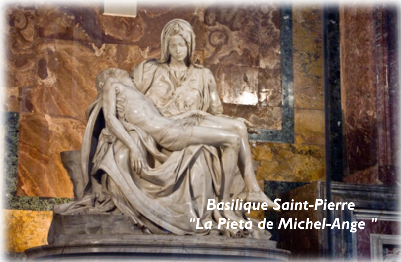
Basilique Saint-Pierre "La Pietà de Michel-Ange"

Nous avons franchi les Portes Saintes, un geste simple, mais fort qui nous rappelle