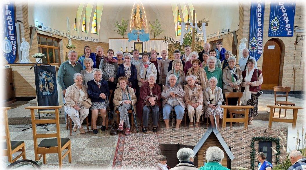
Chapelet à la chapelle de Notre-Dame de la Médaille Miraculeuse à Houraing le 4 mai, à l'occasion de la fête de Sainte Catherine Labouré.